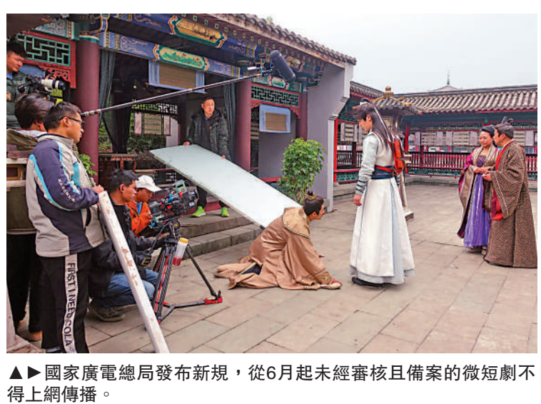
▲▶國家廣電總局發布新規，從6月起未經審核且備案的微短劇不得上網傳播。