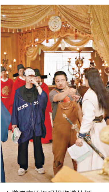
▲導演在拍攝現場指導拍攝。