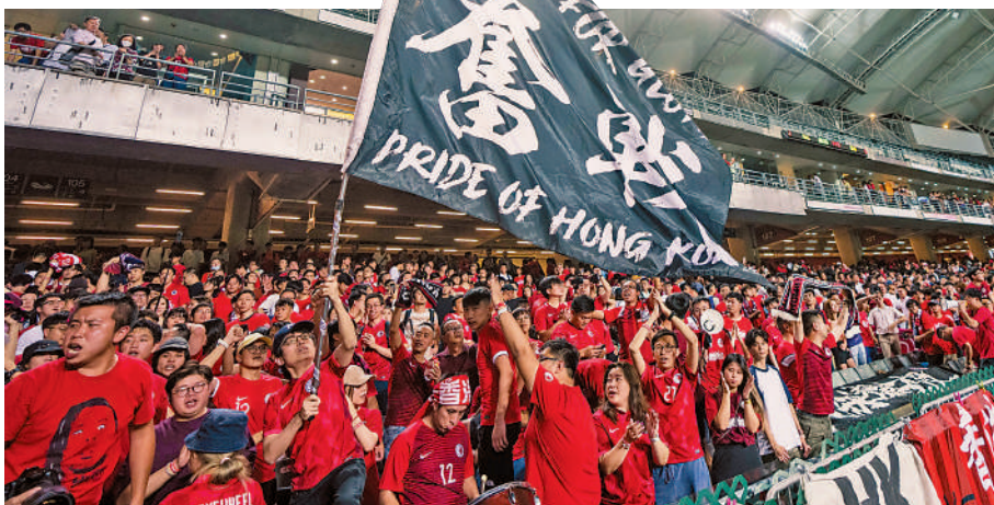
▲在任2年半，安達臣為港足的貢獻，感動了不少球迷。