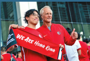
▲球迷遠赴卡塔爾亞洲盃支持安達臣。

支持安達臣的球迷認為他在任2年半以來，訓練球員學習目前世界足球流行的高位逼搶踢法，改變球員心態，不要只踢龜縮防守反擊的傳統風格。讓球員感受到國際水平訓練方式，球員心態慢慢得到改變，從以前比賽未踢已擔心落敗，變成如今踢法進取，他在成績的貢獻亦有目共睹，亦令球迷觀戰時氣氛更激昂。因此，即使安達臣如今人望高處另謀高就，所有香港球迷都應該向他講聲多謝，因為安達臣為港隊帶來戰術及心態的革命性轉變。