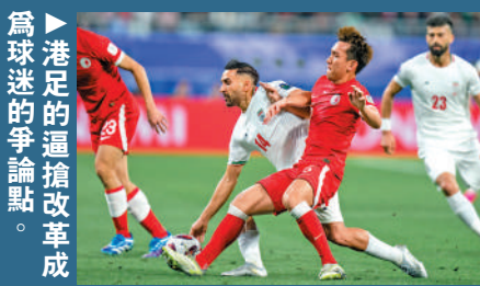
▲為港足的逼搶改革成為球迷的爭論點。