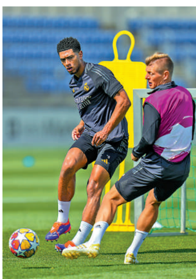
▲比寧咸（左）為歐聯決賽積極操練。

值得一提，比寧咸上季在多蒙特最後一個球季，已獲選為2023年德甲最佳球員，連續兩季在不同聯賽獲獎，足見其風頭一時無兩。而他亦將在本周末返回家鄉英國，率領皇馬倒戈多蒙特，勢成這場決賽焦點。