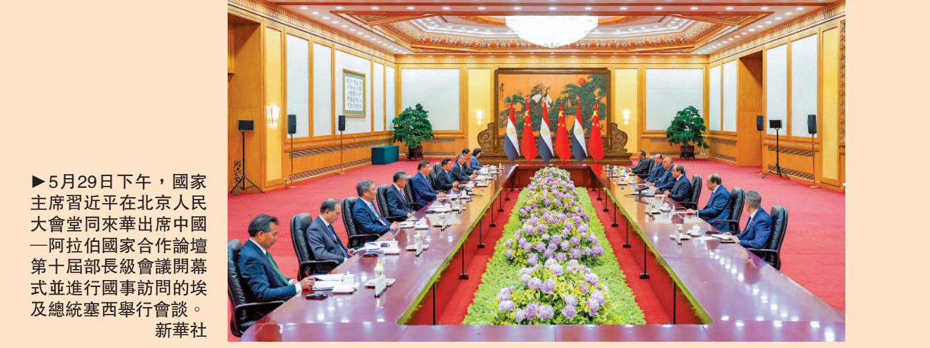
▲5月29日下午，國家主席習近平在北京人民大會堂同來華出席中國—阿拉伯國家合作論壇第十屆部長級會議開幕式並進行國事訪問的埃及總統塞西舉行會談。