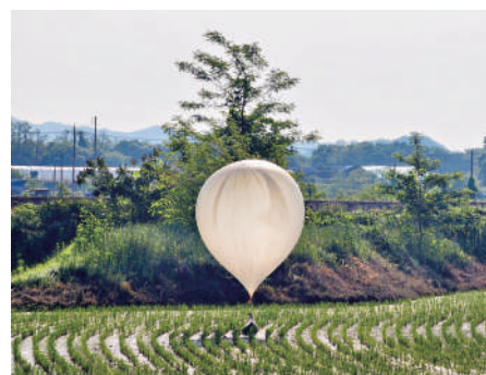
▲「垃圾氣球」內有垃圾和疑似糞便的污物。

分析指，韓國大量民間團體長期向朝鮮境內空投裝有傳單等宣傳物的氣球，亦對朝使用擴音器廣播，詆毀朝鮮政權，而韓國政府從未進行有效管控。朝鮮此次採取這種對等手段，可以說是一種心理戰，主要目的是希望韓國管控對朝宣傳。