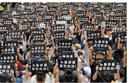
▲三星電子工會成員24日在總部大樓前示威。

「全國三星電子工會」總共有超過2.8萬名會員，約佔三星電子全體員工的22%。三星電子勞資雙方今年1月