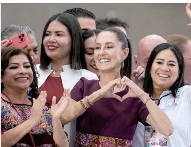
▶ 墨西哥執政黨總統候選人欣鮑姆（前排中）29日參加競選活動。

策，並強調墨西哥需要和平與安寧。欣鮑姆被稱為洛佩斯的「門徒」，被問到如何應對暴力問題時，她表示將延續洛佩斯的政策，向年輕人提供學徒機會，鼓勵他們不要加入販毒集團。當天下午，反對派政治聯盟「墨