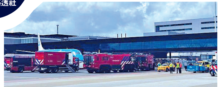
◀ 荷蘭史基浦機場29日發生致命事故，急救人員趕到現場。網絡圖片

經墨西哥湧入美國的非法移民對美墨關係構成威脅。美國今年亦將迎來大選，拜登政府急於減少非法移民數量。美媒本月稍早爆料稱，為討好美國，墨西哥用巴士將非法移民運至該國南部，讓他們遠離美國。