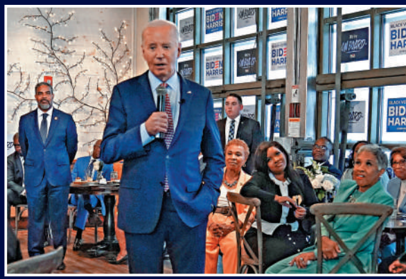
▲ 拜登的經濟政策引起硅谷投資人不滿，恐影響其選情。

還有一些投資人公開批評拜登，但也不願支持特朗普。美國風險投資協會行政總裁富蘭克林指出，硅谷政治風向轉變是美國人對兩黨均感到失望的縮影，「我無法再在科技議題上信任民主黨，也無法再在商業議題上信任共和黨」。