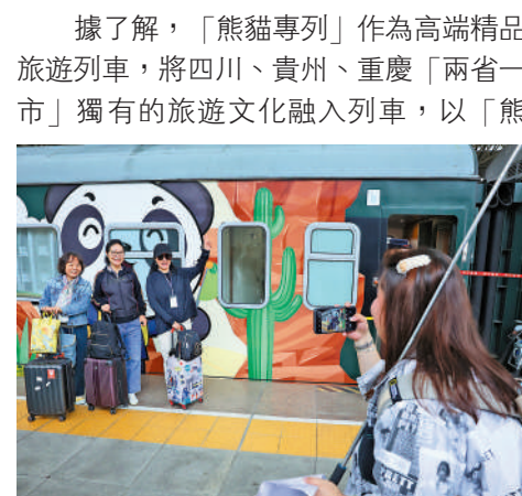
▲5月8日，旅客在貴陽火車站一列「熊貓專列」前拍照留念。

6月15日起，全國鐵路在實行新的列車運行圖同時，將提升旅客購票體驗，擴大計次票、定期票、旅遊套票等新型票制產品應用範圍，對部分客座率較低動車組列車票價實行靈活折扣，最低4折，讓旅客享受更多優惠票價。同時，全國120個車站可實現便捷換乘，80個車站提供互聯網訂餐服務，鐵路「暢行碼」覆蓋所有動車組列車。此外，開好「熊貓專列」「天山號」等精品旅遊列車，打造消費新場景，助力旅遊經濟發展。