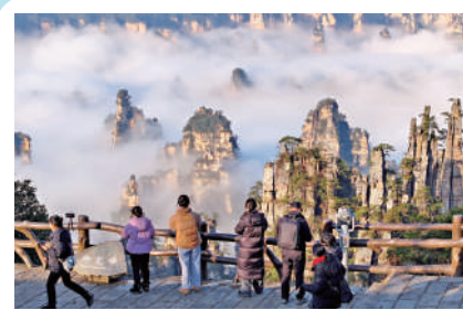
▲張家界位於湖南省西北部，因「奇峰三千、秀水八百」而聞名。

記者了解到，目前廣鐵還正在加快推進「廣州南站至廣州站聯絡線」、廣州站和廣州東站改造等一系列「軌道上的大灣區」工程建設；屆時廣深港高鐵路、京廣高鐵路、廣汕高鐵路、廣珠城際等多條線路將引入廣州中心城區車站；而廣州白雲站也將與廣州站、廣州東站構建「三站一體」的中心城區鐵路組合樞紐，促使灣區旅客出行將更加便捷。