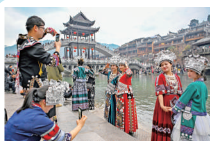
▲遊客穿着特色服飾在鳳凰古城景區拍照。

還值得關注的是，調整列車運行圖後，廣州東站至西九龍站高鐵路車由每日20列增加至26列，較去年初開通時增逾一倍；深圳北站至西九龍站由每日146列增加至159列；福田站至西九龍站由每日97列增加至106列。據悉，相關車票將於明日（6月1日）開始發售。