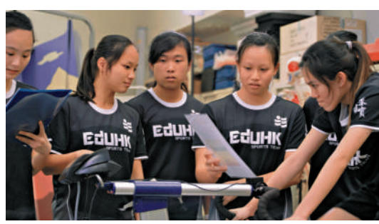
▲教大體育教育是其中一個競爭最激烈的課程，達43人爭一學位。

【大公報訊】記者魏溶報道：大學聯招（JUPAS）首輪改選前日（29日）截止。八間資助大學於昨日公布以Band A計算，最多人申請及競爭最激烈課程。其中，香港中文大學「工商管理學士綜合課程」共2211人申請，成受歡迎課程，此外理大、城大、浸大及嶺大最多人報讀的課程均為商科課程。體育相關課程競爭激烈，中大「歷史教育榮譽學士」及「體育教育榮譽學士」成競爭最激烈課程，平均每43人爭一位。