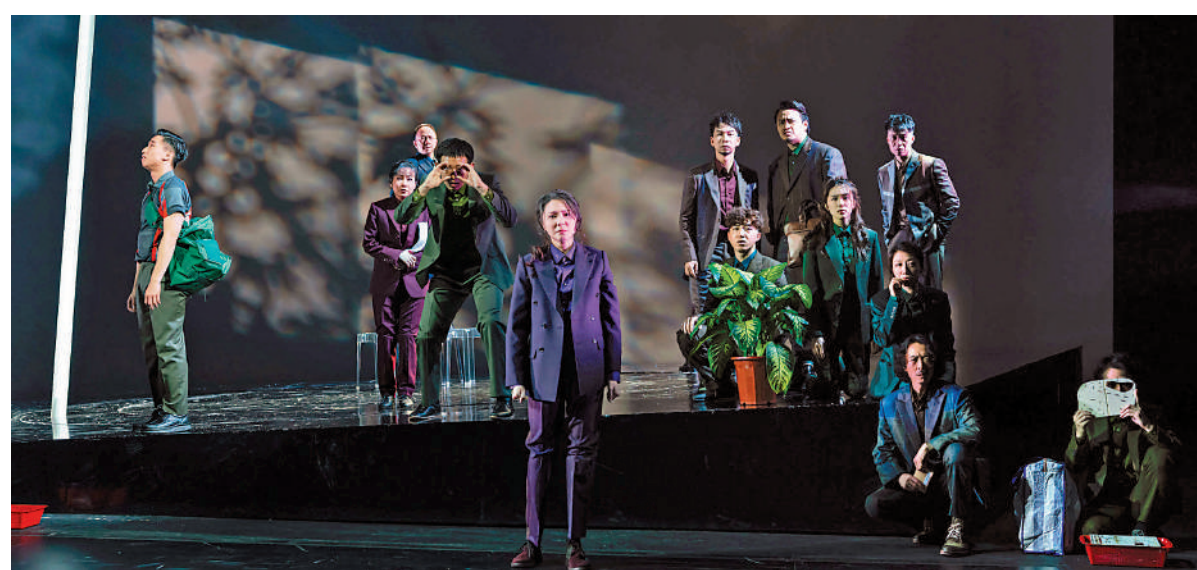
▲《白湖映像》正於香港大會堂劇院演出。

從較淺白實在的《雞春咁大隻甲由兩頭岳》，到較艱澀虛無的《在天台上冥想的蜘蛛》，整個系