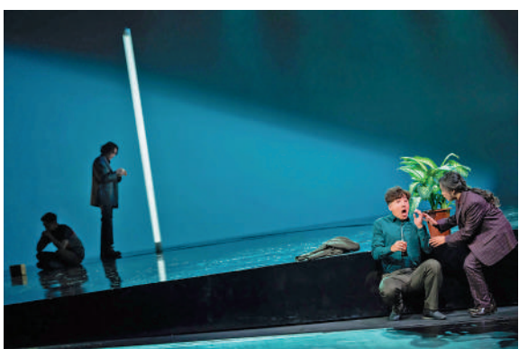
▲《白湖映像》的傾斜舞台。

列試圖於寫實情景，包括茶檔、茶樓、房子、旅館、天台，鋪陳非寫實甚至超現實故事；劇中世界自成邏輯，除了時代背景一致、都有相宜穢語，幾套作品的共通點，是劇中人各自受到生活難題或家庭負擔所困，難以動彈，家家有本難唸的經，但似乎都在等待什麼、尋找什麼。該系列另一特點是獨特巧妙、宛如神來之筆的語言運用，劇中人看似同一屋簷下又似活在平行時空，像在對話，卻牛頭不