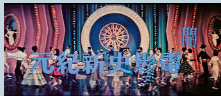
▲1963年歌舞片《教我如何不想她》。

這類預告片不時採用戲內歌曲，其中更有預告片採用整首歌曲，亦有邀請主角亮相預告片，現身說「戲」，如導演楚原的作品《七十二家房客》（1973）等。