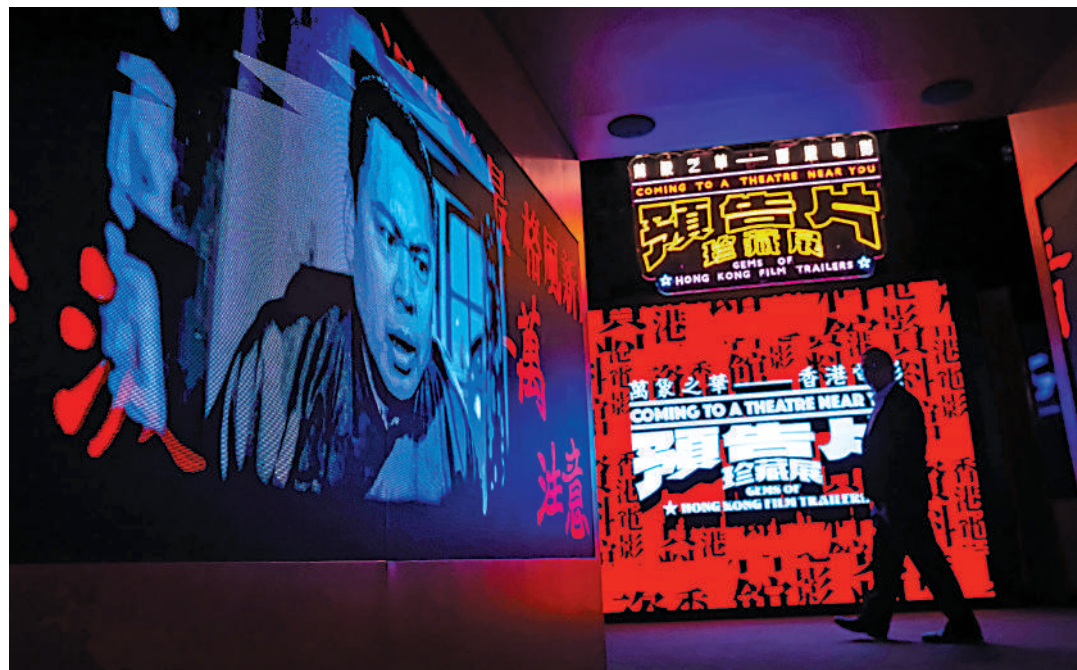
▲「萬象之華——香港電影預告片珍藏展」今起舉行。