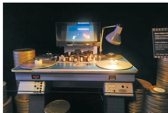
▲展廳現場展出菲林年代預告片編輯機。

展廳部分位置還很適合打卡，觀眾可與《歡喜冤家》（1959）一眾主演演員，包括謝賢、嘉玲、胡楓、南紅的宣傳紙板合照留念。還特設星光隧道，走過隧道，兩旁屏幕放映的是明星雲集的預告片精華，增強沉浸式觀展感受。