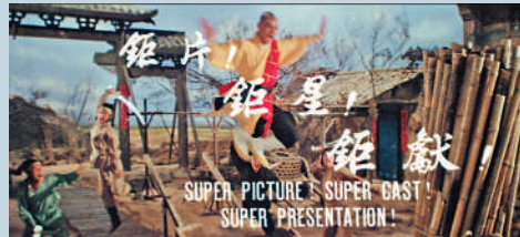
▲1984年功夫電影《五郎八卦棍》。