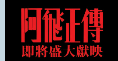
▲1990年《阿飛正傳》。

為了迎合海外觀眾的需求，香港電影在輸出海外時，就要有不同版本的預告片，如電影《新蜀山劍俠》（1983）的預告片就有本地版、日本版、英語版等，針對不同國家和地區觀眾的喜好，剪輯策略各異。