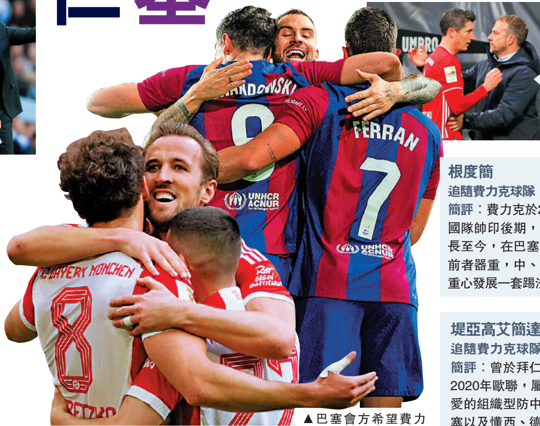
▲拜仁球迷期望高柏尼將哥迪奧的足球理念重新注入球隊。

追隨費力克球隊：拜仁慕尼黑 簡評：曾於拜仁隨費力克勇奪2020年歐聯，屬後者陣式中最愛的組織型防中，加上出身巴塞以及懂西、德語，可當前者溝通橋樑。