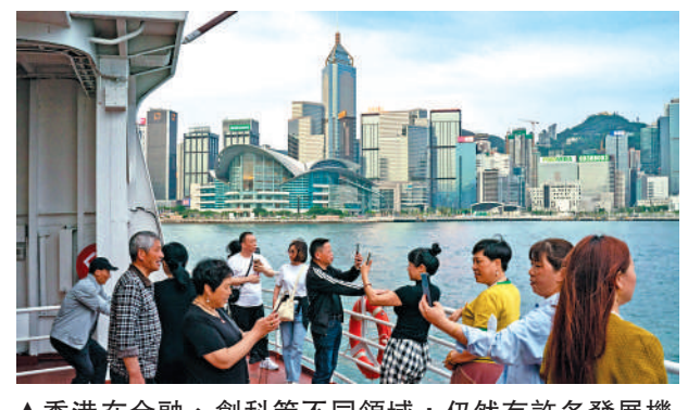
▲香港在金融、創科等不同領域,仍然有許多發展機會。