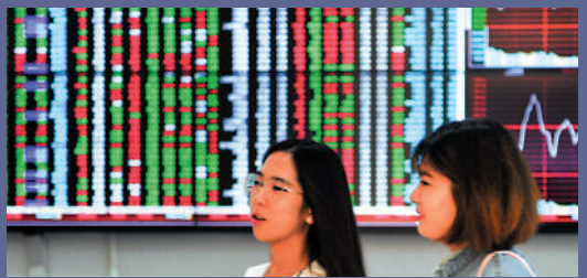
▲今年4月,外資流入中國股市近600億元人民幣。資料圖片

市場復甦步伐尚未加快,但已看到中國股市有多項因素正在吸引外資,包括估值偏低、海外基金低配、刺激經濟政策持續出台、穩健的人民幣走勢以及出行數據強勁,所以相信中國股市最壞的情況已經過去。