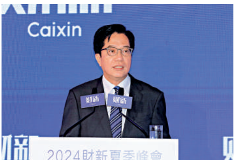
▲黃偉綸表示,香港是全球頂尖的國際金融中心,在很多方面取得成功,但不能自滿,未來必須繼續加速發展。

署理財政司司長黃偉綸昨日在「2024財新夏季峰會」上表示,美國利率持續高企,香港面臨的挑戰不少,但是香港在金融、創科等不同領域,仍然有許多發展機會,關鍵在於能否把握好這些機會。黃偉綸強調,香港是全球頂尖的國際金融中心,在很多方面取得成功,但不能自滿,未來必須繼續向前、加速發展,因此會推動包括金融科技、虛擬資產在內的金融創新,發展過程中也會確保將風險保持在可控水平。