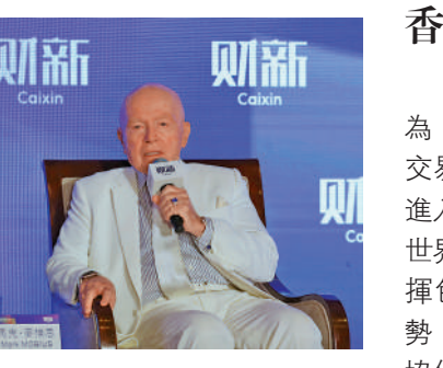
▲麥樸思認為,只要香港發揮自身獨特優勢,必吸引更多資金,國際金融中心地位將會更穩固。

機數量多於當地人口,每個人都可以藉不同渠道獲取信息,並分享自己的觀點,這為世界帶來革命性的改變,相信新興市場的增長率將會加快。麥樸思看好新興市場前景。