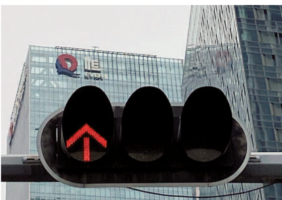
今年1月，香港法院已向恒大發出清盤令。