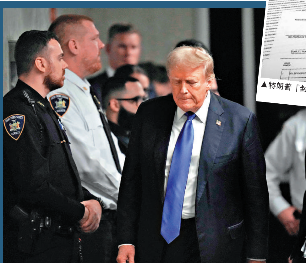
▲ 特朗普被定罪後，走出法庭見記者。