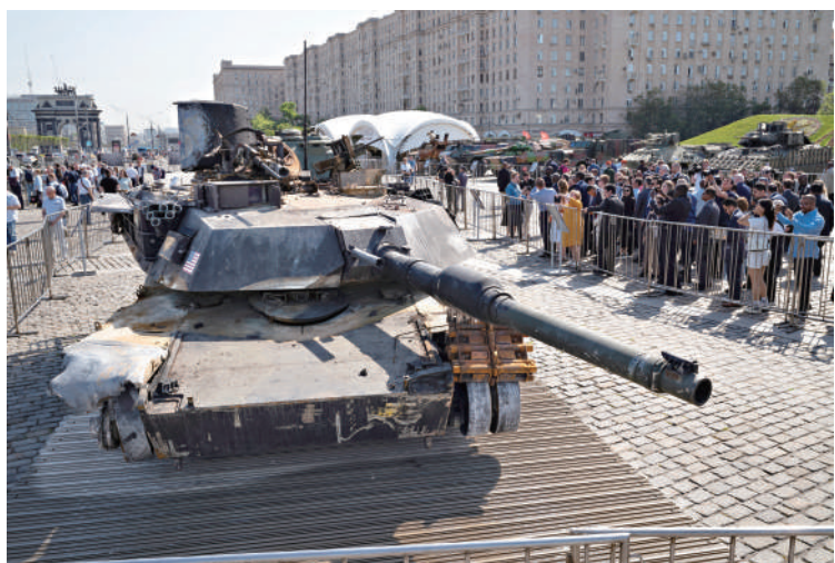
▲ 俄軍在烏克蘭擊毀的美製武器被帶回莫斯科展覽。

近日，北約秘書長斯托爾滕貝格、法國總統馬克龍和德國總理朔爾茨均表示支持烏軍襲擊俄境內目標。丹麥外交大臣斯穆森亦表示，丹麥當局已允許烏克蘭用其承諾提供的F-16戰機襲擊俄領土。意大利外長塔亞尼則表示，該國向基輔提供的任何武器都不應當被用於深入打擊俄領土。