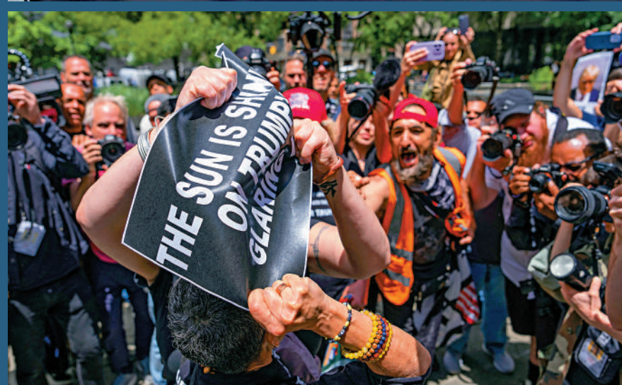
◀ 特朗普支持者和反對者當街扭打。