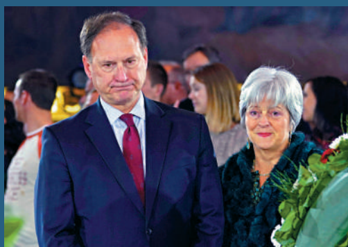
▶ 民主黨要求保守派大法官阿利托(左)迴避涉特朗普案件。

阿利托被揭在2021年1月6日美國國會暴亂事件發生後不久，在弗吉尼亞州的住宅外倒掛美國國旗；去年夏天，他位於新澤西州的海濱別墅外還曾出現「向天請願」的旗幟。倒掛美國國旗和懸掛「向天請願」旗幟均被視為特朗普支持者使用的抗議符號，與「2020年大選舞弊」陰謀論有關。民主黨要求阿利托迴避涉特朗普案件，但阿利托5月29日表示拒絕。