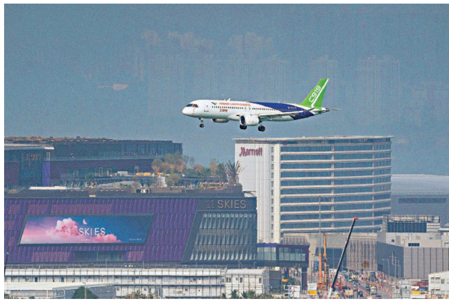
▲去年12月12日，國產大飛機C919飛臨香港國際機場上空。