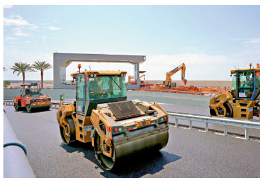
▲目前深中通道已完成全線瀝青路面鋪裝。

【大公報訊】記者方俊明中山報道：記者5月31日從廣東省交通運輸廳官網「高速公路收費查詢」登陸看到，部分高速站經深中通道的收費標準已經上線。深中通道到寶安的第一個收費站：深圳機場站，因尚未開通，所以官網暫不可查詢，按照原發改部門公布的收費標準，推斷最低價格應為粵通卡62.7元（人民幣，下同）、現金收費66元。