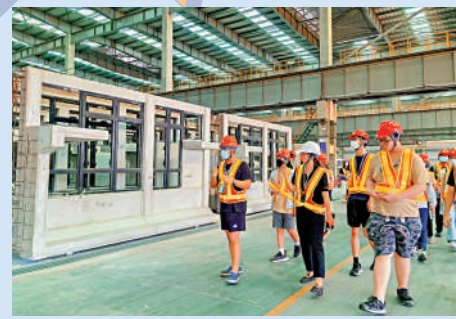
▲「建造業青年大灣區交流計劃」交流團參觀一港企位於肇慶的MiC生產基地。