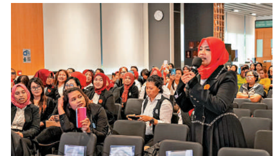
▲近180名外傭昨日獲邀參觀東九龍警察總部，透過互動加強她們防罪防騙意識。

名傀儡戶口持有人，不少是外地傭工，由於對香港法例不熟悉而誤墮法網。警方提醒市民不要將個人銀行戶口出租、出售或借予別人，犯罪集團有可能將戶口用作接收或轉移犯罪所得，戶口持有人有機會觸法。