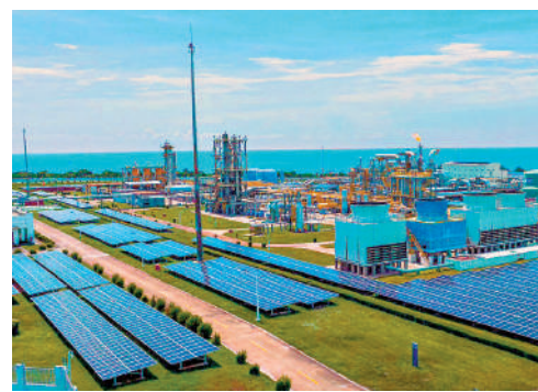
▲中海油在綠色發展錄得豐碩成果，持續加強用能替代，減少碳排放44萬噸。

科技創新是中海油三大工程之一，相關負責人補充稱，中海油已經設立人工智能(AI)研發新部門，探索中海油獨有的AI發展之路，釋放新生產力，正在試點應用AI工作已涵蓋現場安全監測預警等。