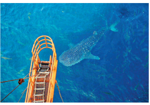
▲中海油堅持在保護中開發的理念，在作業平台上經常發現鯊魚蹤影。

中海油在島上項目完成增儲上產目標的同時，與島民合作完善基建、教育和經濟，將鄉村振興戰略落地生根。