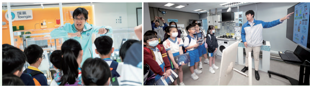
▲「綠火焰校園大使」到訪煤氣公司總部參觀學習，聽煤氣工程師講解煤氣安全。