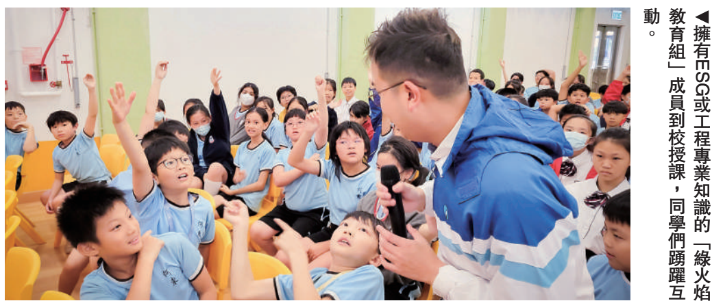
▲擁有IT或工程專業知識的「綠火焰教育組」成員到校授課，同學們踴躍互動。