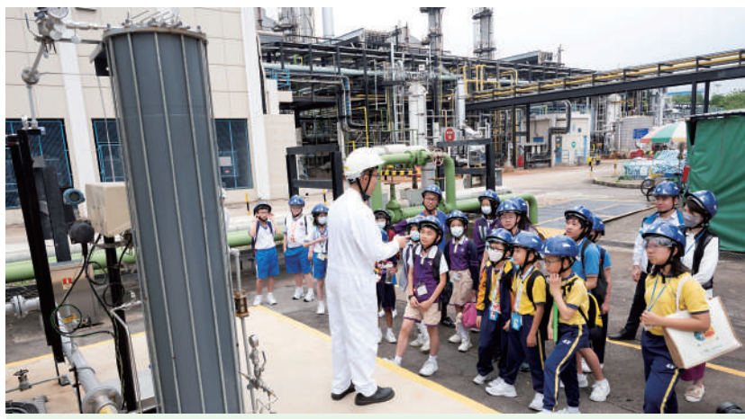
▲「綠火焰校園大使」到訪大埔煤氣廠，實地認識燃氣生產及氫能方案。