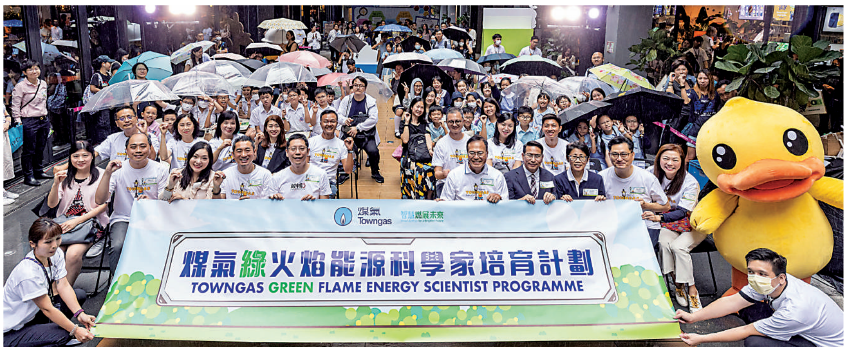
▲「煤氣綠火焰能源科學家培育計劃」在2023年9月推出，廣受學界歡迎。

此外，煤氣公司還為學生度身訂造了《秒懂的能源百科》學習卡及「鬥氣冤家」桌上遊戲，作為講解能源科學的輔助教材。《秒懂的能源百科》透過52張涵蓋歷史軼