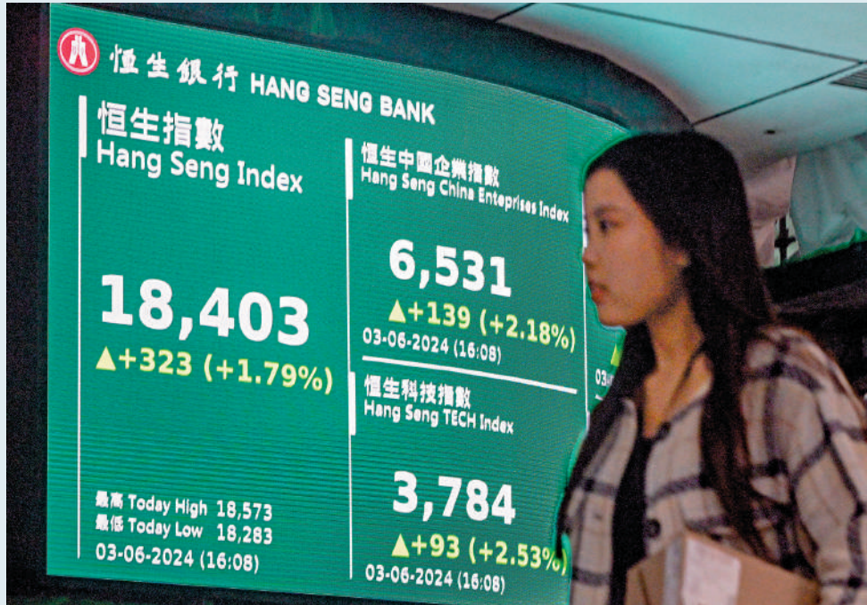
▲亞太區股市造好，港股「六絕月」開局飆高323點，終止三連跌。