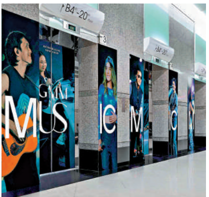
▲GMM Music與騰訊音樂和騰訊合作，業務增長有望加速。

業界人士認為，騰訊及TME投資GMM Music，對雙方的音樂業務發展產生深遠影響，並透過資源共享、優勢互補，共同推動亞洲音樂產業的創新與發展，為全球音樂愛好者帶來更多優質的音樂內容與服務。同時也將為泰國音樂產業走向國際市場提供強力支持，促進亞洲音樂文化的交流與融合。