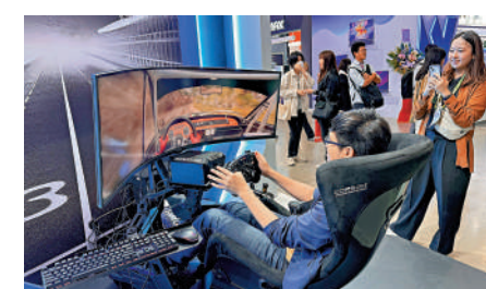
▲在2024台北電腦展，民眾體驗最新電子遊戲。

他認為，電力是算力產業的基礎支撐，台當局要確保電力系統韌性和穩定度，重新檢視能源配比。此次電腦展吸引