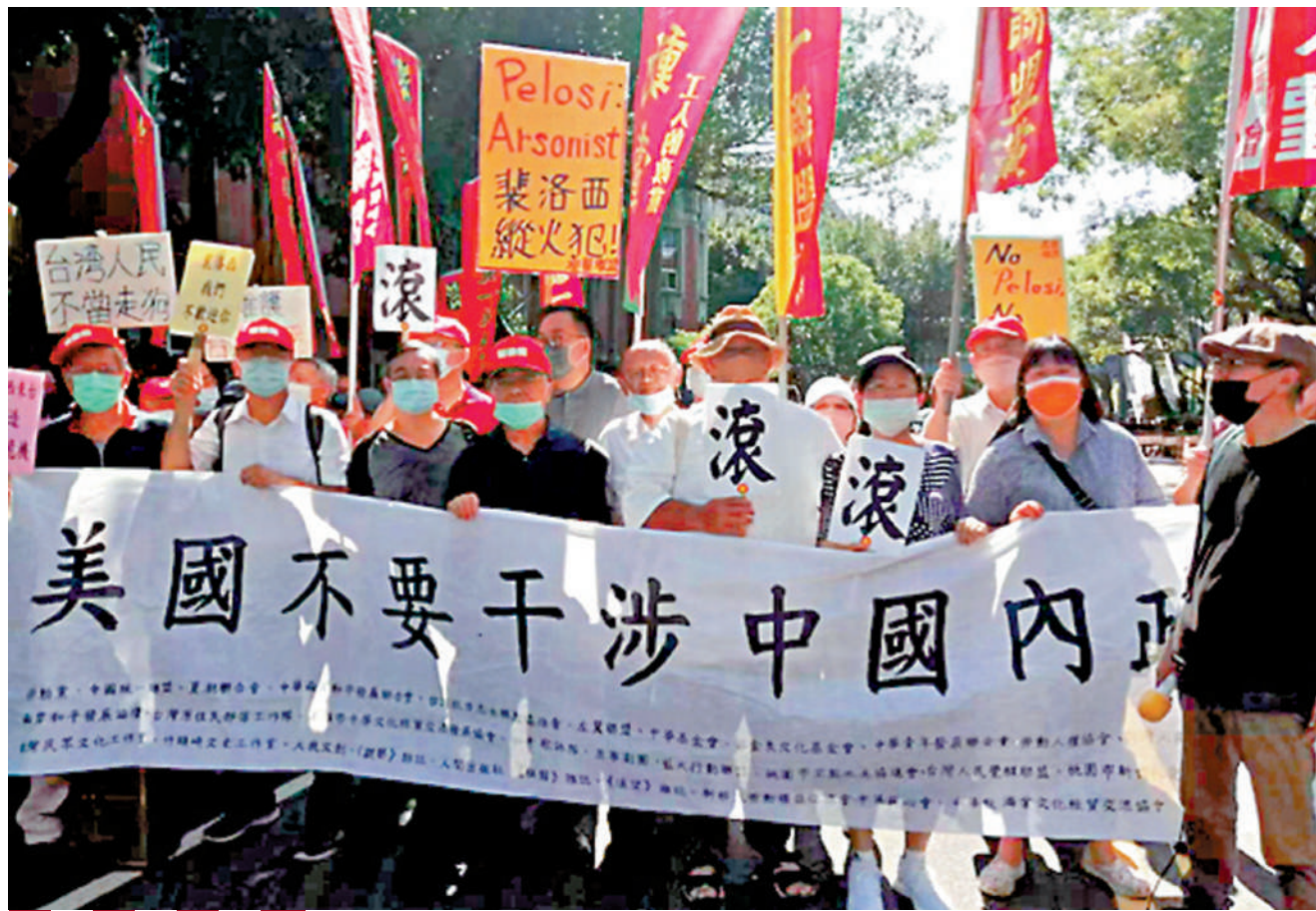
▲台灣民眾舉行集會，批評美國插手台灣問題破壞台海和平。