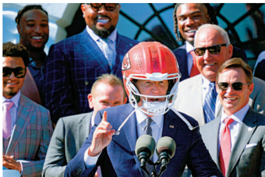
▲頭戴堪薩斯城酋長隊頭盔的拜登上周在白宮出席該隊奪冠慶祝活動。

檢方指控亨特在2016年至2020年總收入超過700萬美元，其中包括來自烏克蘭能源公司Burisma的收入。亨特2014年4月加入該公司董事會。共和黨方面稱，亨特在Burisma任職期間，時任副總統拜登為保護亨特免受可能的腐敗調查，向時任烏克蘭總統波羅申科施壓，要求其解僱正在調查Burisma貪腐案的總檢察長肖金。