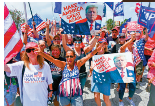
▲特朗普的支持者2日在佛州集會。