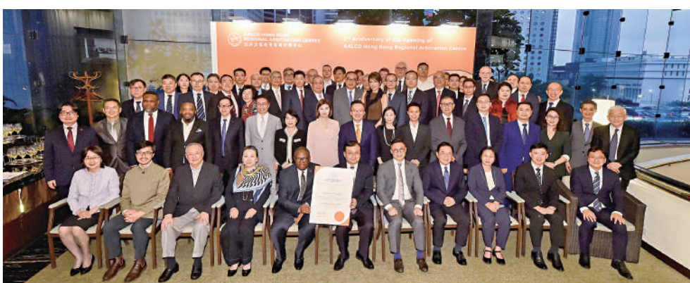
▲亞非法協香港區域仲裁中心昨日舉行正式營運二周年誌慶，暨在冊仲裁員委任儀式。

中心指正籌備於本年內前往埃及和南非訪問，以提升香港專業人士的聲譽和機會，擴大在「一帶一路」範圍內香港專業人士在處理國際法律服務、仲裁和調解服務方面的市場份額。