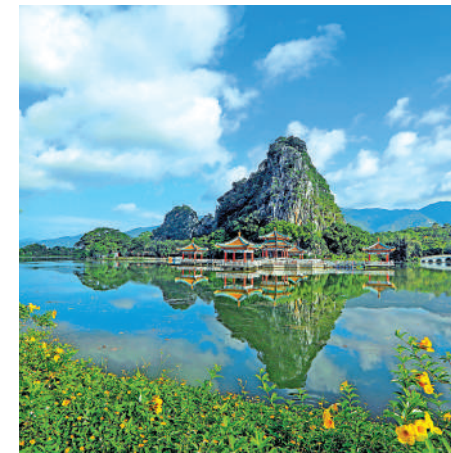
▲增強新質生產力發展的綠色動能，要聚焦氣候變化對人類生存環境影響的原因，加快綠色低碳技術創新。

培育和發展新質生產力，要正確處理經濟發展和生態環境保護的關係，實現生態效益、經濟效益、社會效益相統一。發展新質生產力既要遵循生產力發展規律，又要遵循自然規律，生動體現了保護生態環境就是保護生產力、改善生態環境就是發展生產力，蘊含着人與自然和諧共生的價值追求。要清醒地認識到，發展綠色生產力，建立綠色低碳循環發展的經濟體系的一項長期重大戰略任務，要將長遠目標和現實條件有機結合、將低碳目標和經濟增長目標有機結合，有效防止將「雙碳」目標短期化和碎片化，避免採取激進式、運動式減碳和「一刀切」限產停產等措施，人為阻斷產業鏈供應的正常運行，損害發展新質生產力和建設現代化經濟體系長遠目標。