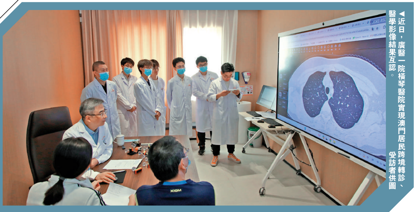
▲近日，廣醫一院橫琴醫院實現澳門居民跨境轉診、醫學影像結果互認。