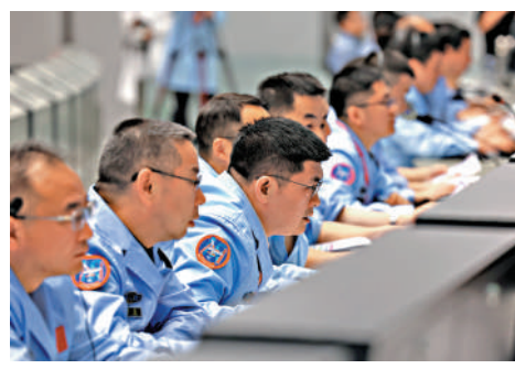
▲工作人員在監測嫦娥六號月背轉移交會對接

後續，嫦娥六號軌道器和返回器組合體將與上升器分離，進入環月等待階段，準備擇機實施月地轉移軌道控制，經歷月地轉移、軌道器和返回器分離等關鍵步驟後，按計劃返回器將攜帶人類第一杯月背樣品着陸在內蒙古四子王旗航天着陸場。