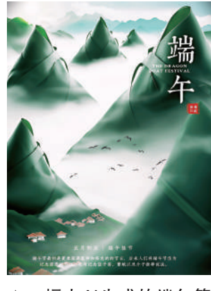
▲一幅由AI生成的端午節賀圖幻化為山。

其實，AI未來還有很長一段路要走，這股風始終要吹過。我們要頭腦清醒，AI不是黃金礦場，多沉澱、多思考才是賺錢與否分水嶺。