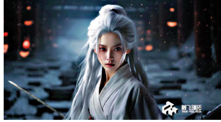
▲在Sora發布前上線的微短劇《白狐》劇照。

早在Sora問世之前，內地相關行業已經在嘗試利用AI創作影視作品，微短劇《白狐》就是在Sora發布前上線；中國首部AI全流程製作的動畫大電影《愚公移山》則在去年12月官宣開機。由此可以看出，關於生成式AI深度參與影視內容創作的探索，國內早有先行者。業內人士表示，中國未來在應用AI技術方面，完全有機會走在世界前面。