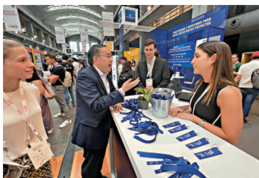
許正宇（左二）在西班牙馬德里參觀南方峰會的展覽攤位。

許正宇在馬德里時間6月5日出席西班牙馬德里參與科技和初創企業盛事南方峰會，並與西班牙證券交易所的高層管理人員會面，及出席商界聯誼酒會。許正宇分