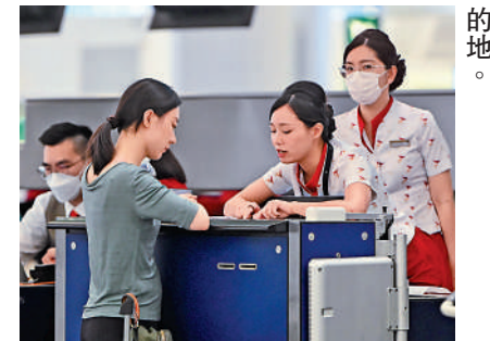
國泰客運力已恢復疫前的八成，並覆蓋全球約80個目的地。

據介紹，國泰往來沙特利雅得的直航客運航班將於10月28日開辦，每周三班，逢星期一、四、六出發，由空巴A350-900客機營運，備有商務客艙、特選經濟客艙及經濟客艙以供選擇。另外，國泰貨運目前營運每周往返香港和利雅得的貨運航班。