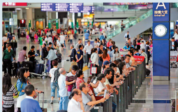
國泰10月直飛沙特首都利雅得之後，香港與「一帶一路」沿線國家的聯通、貿易及文化交流進一步加強。