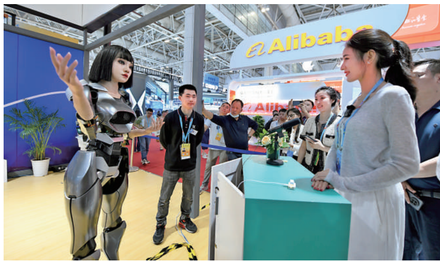
內地人形機器人產業急速發展，可在多個場景應用。

科大訊飛董事長劉慶峰認為，中美在通用大模型的差距，是半年至一年半之間的動態追趕，估計與GPT-4的差距在半年之內。同時，最近阿里巴巴大幅下調「通義千問」大模型價格，之後騰訊（00700）大模型亦跟隨降價，百度文心一言則有兩款主力模型免費，連串AI大模型降價行動，有助AI普及應用，加速創新發展、技術突破，實現科技自強