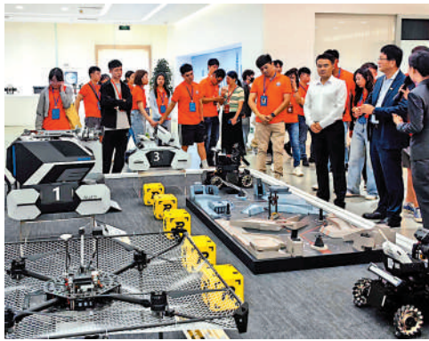
▲台青參觀深圳大疆創新科技公司。

參加此次活動的台灣青年們大部分是第一次來廣東，第一次來深圳。活動期間他們還將與深圳的青年學生進行交流互動，共同探討創新創業、文化交流等話題。