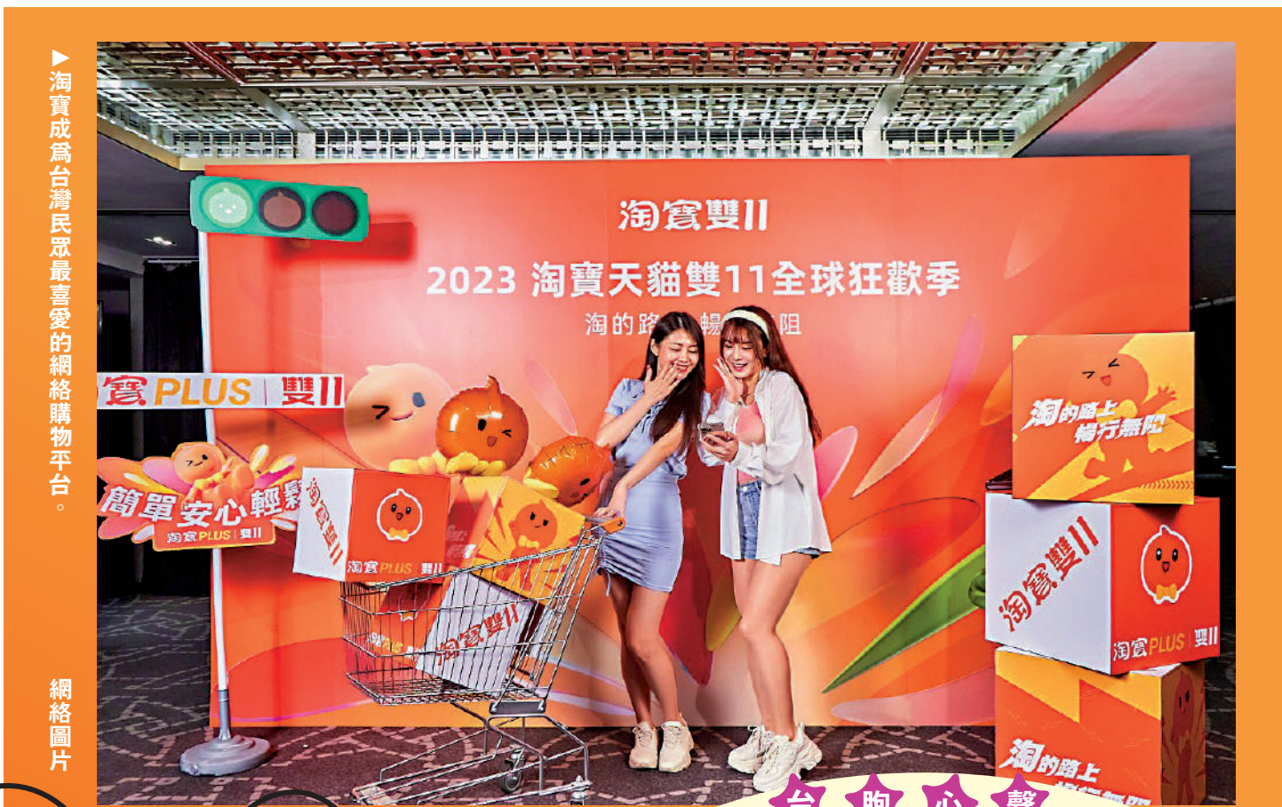
▲淘寶成為台灣民眾最喜愛的網絡購物平台。