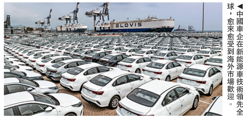
▲中國車企在新能源車技術領先全球，愈來愈受到海外市場歡迎。

由於新能源車產業將帶來巨大收益，特區政府與香港業界應好好研究如何把握這個難得發展機遇，特別是早前特區政府公布的《香港創新科技發展藍圖》，將生命健康科技、人工智能與數據科學、先進製造與新能源科技等產業列為發展重點，後兩者與汽車產業息息相關，若能推動香港相關企業及科研機構，與中國車企合作，定必產生巨大效益，既推動中國車企技術更加進步，亦可成為香港經濟另一新發展動力，故特區政府應加力研究，善用當前形勢，不要錯過大好良機。