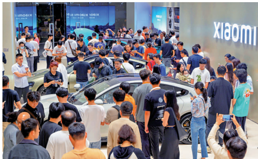
▲小米正招兵買馬急聘大量工人，確保今年交付10萬輛SU7電動車。

另外，小米汽車熱銷，市傳小米正積極與上游供應商緊密合作，希望大幅提高零件供應量，以應付快速增長的市場需求。市場人士透露，小米SU7大幅提升加單比例，其中一類零件從每個月約1萬套增加至最近的1.8萬套。