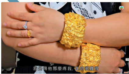
▲何伯送給何太多件首飾，包括價值不菲的「流星錘」龍鳳鉗。