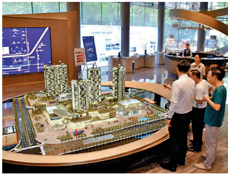
▲電建都匯府參與「以舊換新」，吸引不少睇樓客。

電建都匯府共5幢，提供502伙，單位面積由120至190平米，全為四房兩廳間隔。其中，140平米戶型設有入戶電梯前廳，南向橫廳設計，將空間的靈活性和開放性做到很大。該戶型觀景露台連接客廳、飯廳，同寬約7米，與書房形成對流。主人套房面積21平米，配有獨立浴室和衣帽間。