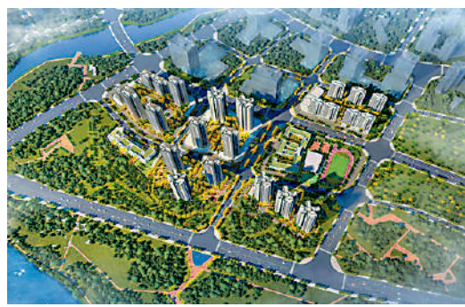
▲中建·映花悅府為大型項目，由24幢16至33層高物業組成。

項目配套齊全，設有陽光草坪、戶外會客廳、全齡遊樂空間、健康跑道、健身活動空間。另外，屋苑自帶約3000平米商業配套，東側有水果蔬菜交易批發市場。開車約10分鐘可到達星光匯、華潤萬家等大型商超。項目北側規劃有商業中心，配備大型生活超市、藥店、酒樓、餐飲店，讓住戶在家門口就能滿足各式生活需求。