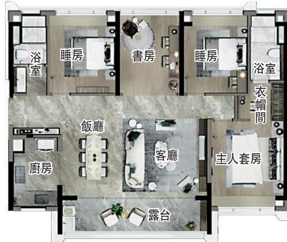
▲電建都匯府140平米四房兩廳戶型圖。