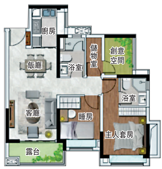
▲中建·映花悅府87平米兩房+一房兩廳戶型圖。