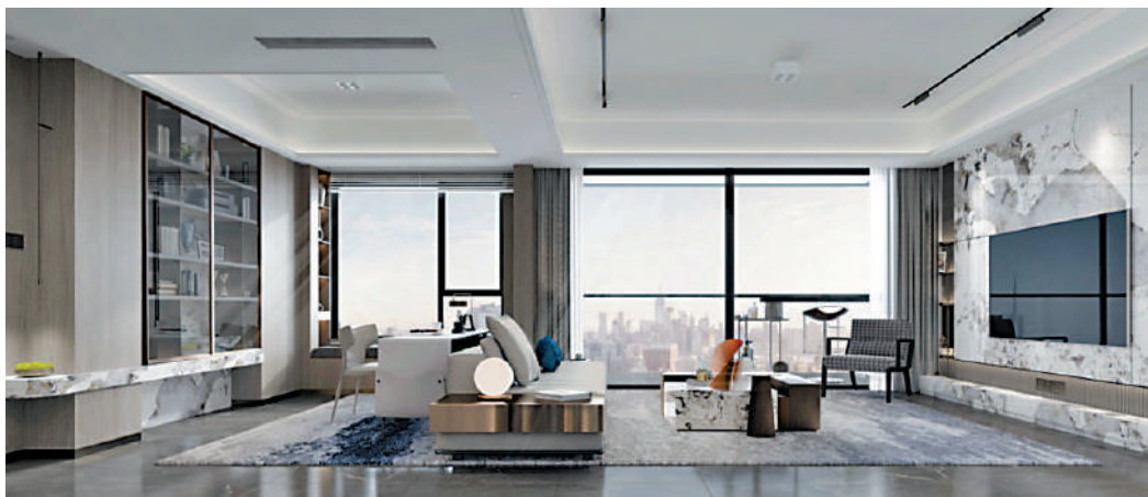
▲電建都匯府單位面積由120至190平米，全為四房兩廳間隔。