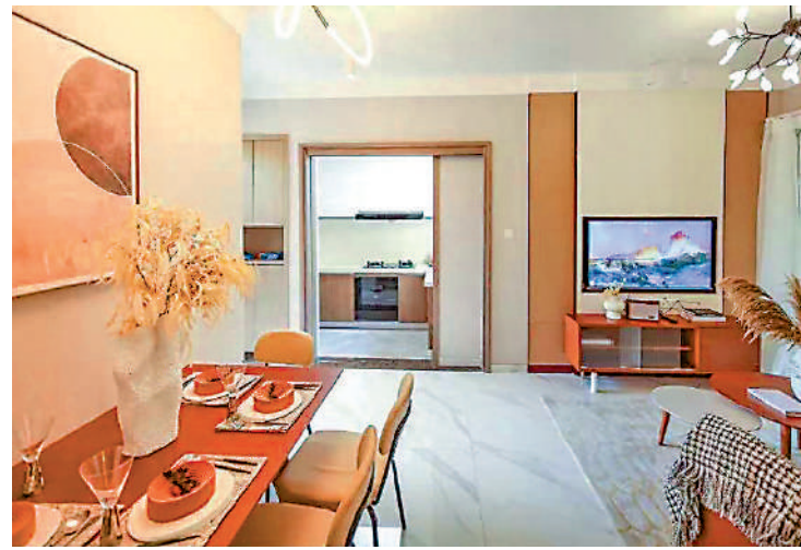
▲中建·映花悅府提供2418伙，面積由62至99平米。