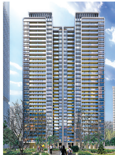
▲電建都匯府外型時尚，充滿時代感。