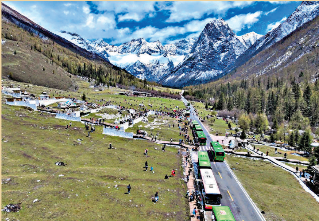
▲假日期間，川西四姑娘山景區內遊人如織。