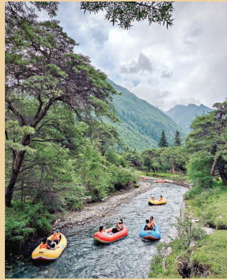
▲四姑娘山景區約4公里的雙橋溝漂流適合慢下來欣賞沿途的風景。