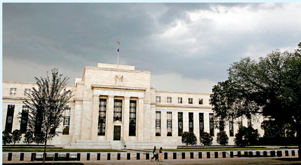
▲美聯儲將於周四公布6月議息結果，幾乎所有預測都認為利率將維持不變。