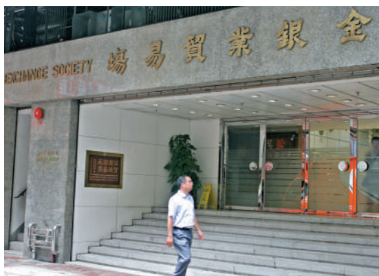
金銀業貿易場隨着時代的發展和進步，逐漸提升黃金產品純度和標準。