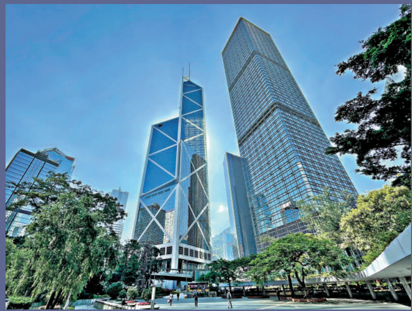
香港擁有完善的金融架構和法律制度，能夠全方位接待全球的金融業界來港。

「事實上，香港金融業是全球三大國際市場之一，在全球經濟秩序中，發揮積極而重要的作用，因此，要唱衰香港是沒有意思的。」張德熙認為，面對市場上種種的謊言，一批不懷好意的壞分子，甚至是國際性的制裁、地緣政治因素等挑戰，對於香港而言只是短暫衝擊，最重要的是，香港擁有完善的金融架構和法律制度，而且在兩文三語的教育制度下，能夠全方位接待全球的金融業界來港。