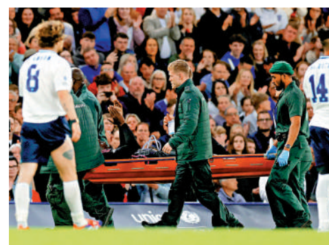
伯特勇戰受傷，需由擔架抬離場。

百米世績9秒58的「9.58」號。不過，37歲的他，在63分鐘的一次防守時疑似扭傷足跟後倒地，之後需由醫護人員出動擔架抬離場。最終英格蘭元老隊以6：3取勝。