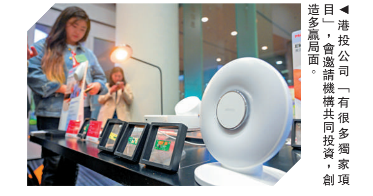
▲港投公司「有很多獨家創項目」，會邀請機構共同投資，創造多贏局面。

業化階段的創新和技術企業。簡單而言，就是透過主權基金資本，推動經濟發展及培育初創。經過50年的發展，淡馬錫目前投資組合總值達3820億新加坡元（約2.2萬億美元）。另外，在全球主權基金之中，中東地區在前十大之中佔比頗多，包括沙特主權基金——公共投資基金（PIF）、阿布扎比投資局等，其中，PIF使命之一為促進沙特經濟發展和多元化，並推動「願景2030」計劃，目標2030年前將總資產推升至2萬億至3萬億美元。阿布扎比投資局早於1967年成立，比淡馬錫還要早，初期目標為了能夠對抗石油價格的波動，其後投資策略轉向多元化，不僅限於財務投資，還會透過資本謀求經濟合作、加深產業鏈合作。