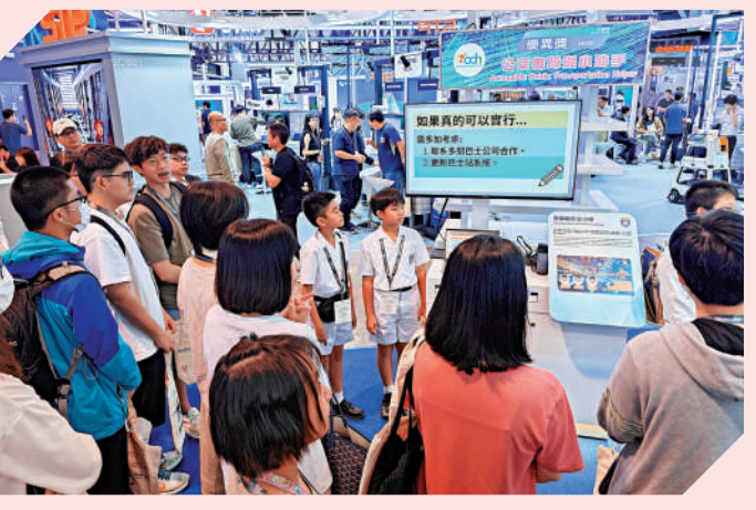
▲港投公司將部分資金投向香港創科。圖為本港小學生展示關於公共交通設施的設想。

陳家齊解釋，香港創科故事「就是香港的年輕人、香港的大學——無論是學生、教授，基本上會以創科為本、以