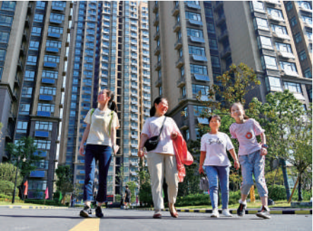
▲廣東房協聯動全產業大行動，搭建促進商品房流通消費的大平台。

生活服務類機構，均可申請參與活動。廣東房協開展「粵團購」「以舊換新全國免佣」「先租後售」「大宗交易對接」等四大舉措。「粵團購」方面，聯動相關城市、區域推出相關優惠措施，由房地產開發企業提供團購專屬房源和專屬優惠。「全國免佣」方面，購買新房金額超過二手