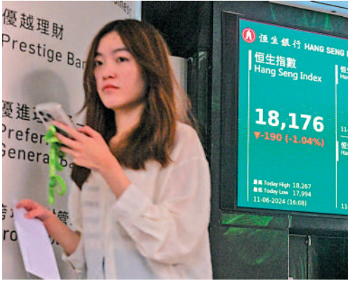
▲內地資金加大對港股投入力度，港股萬八關失而復得，昨日收報18176點。

上海國際能源交易中心集運指數（歐線）主力合約昨日一度跌超過9%，國投安信期貨認為，聯合國安理會通過決議，呼籲哈馬斯與以色列接受停火協議，導致遠期合約或構成較大壓力。