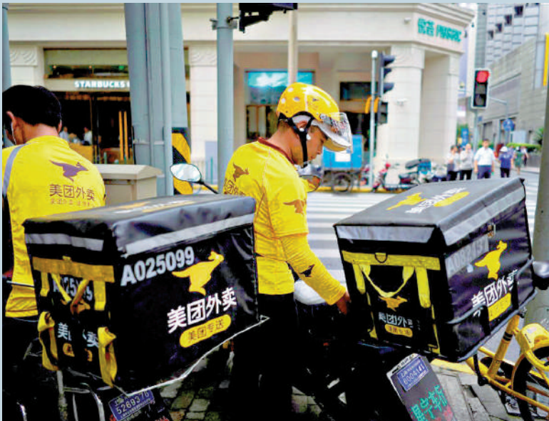
▲美團上周五在市場大手回購，刺激股價昨日升4.4%，是表現最佳藍籌股。