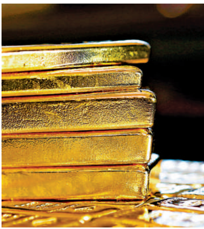
▲金價小幅回吐，金礦股股價卻狂跌。

倫敦期銅昨日曾跌1.8%，每噸見9720美元，擁有大量銅資源的紫金礦業（02899）股價跌4.9%，收報16.64元。江西銅業（00358）股價跌4.7%，收報16.06元。倫敦期鋁昨日曾跌超過2%，中國宏橋（01378）股價跌6.6%，收報12.02元；中國鋁業（02600）股價跌5%，收報5.4元。