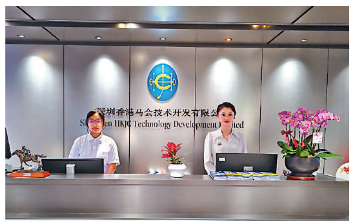
▲SZTDL廣納三地人才。圖為公司前台。