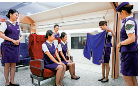
▲6月11日，中國鐵路上海局集團有限公司上海客運段列車長與列車乘務員一起進行服務培訓。

訓過程中發現了列車上的「一個好覺」特色服務——蒸汽眼罩和暖寶寶這些暖心的小物件，滬港動臥列車已經備齊。此外，由於行程較遠，培訓中還會考慮到列車行進途中的一切可能的突發情況，對此，乘務人員們還進行了應急救援和藥品使用等相關知識的培訓。