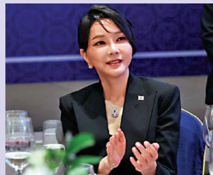
▲韓國第一夫人金建希收受名牌包事件引發巨大爭議。資料圖片