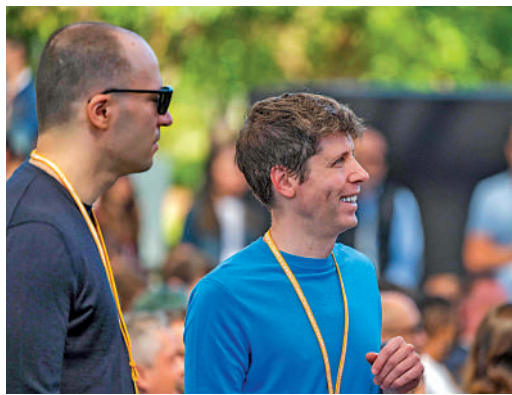
▲OpenAI行政總裁阿爾特曼10日現身蘋果開發者大會。

蘋果公司加入人工智能（AI）軍備競賽。該公司10日推出全新AI系統Apple Intelligence，將AI工具融入iOS 18等系統的最新版本，並與OpenAI公司合作，將ChatGPT引入蘋果的應用。據蘋果介紹，全新AI系統將帶來升級版Siri、AI寫作、語音轉錄、自製表情符號等功能。美國億萬富豪馬斯克批評蘋果將用戶數據出賣給OpenAI，造成安全風險，並威脅要在自己的公司內部禁用蘋果設備。