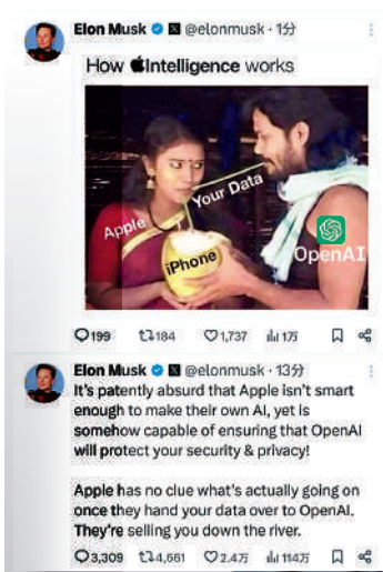
▲馬斯克10日在X發文，批評蘋果引入ChatGPT帶來安全風險。