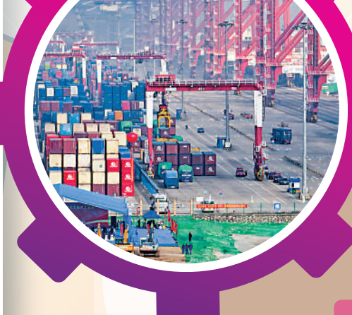
廣州港南沙港區國際通用碼頭工程項目開工現場。

粵港澳大灣區經濟總量從2018年10.8萬億元，到2023年突破14萬億元，以不到全國0.6%的國土面積，創造了全國1/9的經濟總量。