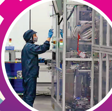
工作人員在融捷能源鋰電池生產車間作業。

目前大灣區旅客年吞吐能力達2.8億人次，貨郵年吞吐能力1140萬噸，航線網絡遍及全球主要城市；大灣區港口貨物年通過能力超16億噸，集裝箱年通過能力約8500萬標箱，航線網絡覆蓋世界主要貿易港口。