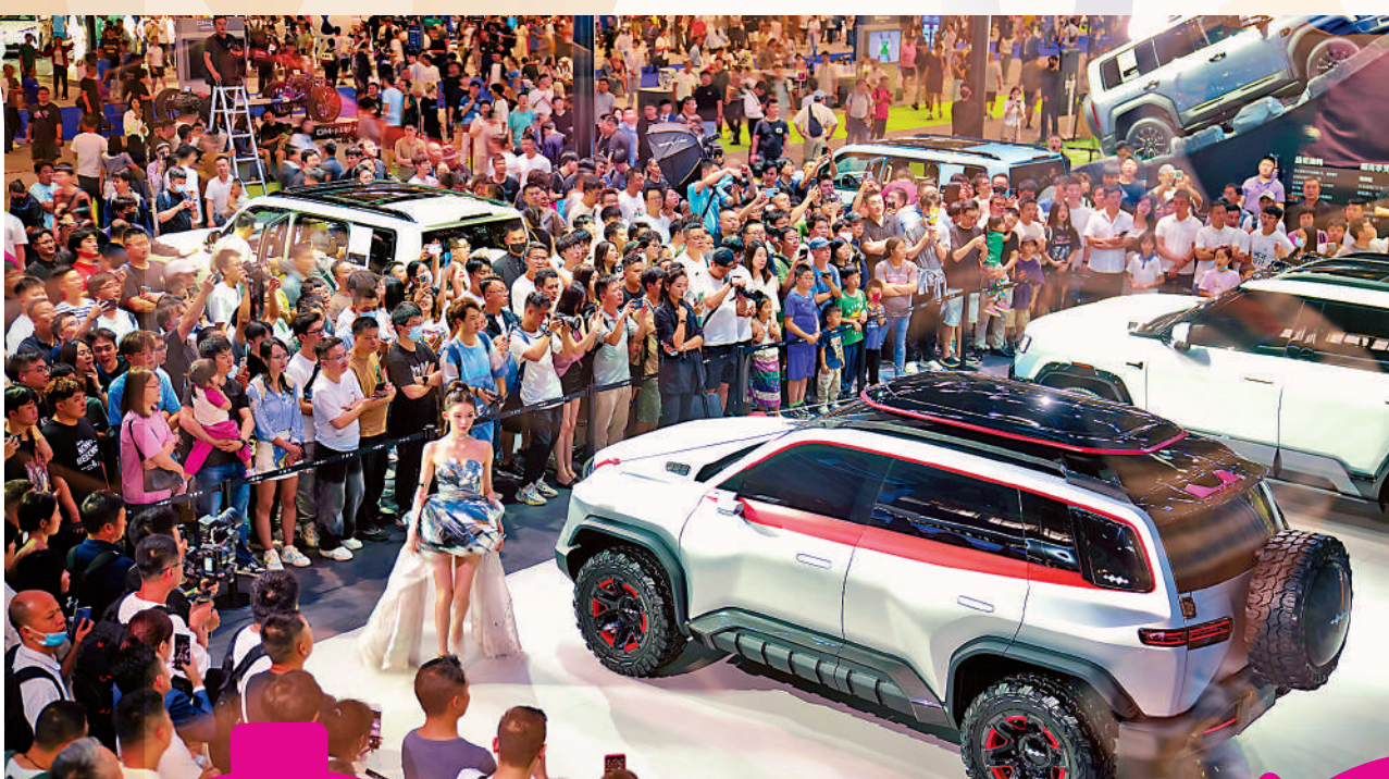
5年間，大灣區綜合實力不斷增強，粵港澳合作更加廣泛深入。圖為6月1日，2024粵港澳大灣區車展在廣州國際會展中心舉行。

金融市場方面，張虎說深港通、債券通「南向通」、跨境理財通、互換通等措施落地實施，人民幣成為粵港澳跨境收支第一大結算貨幣。而「跨境理財通2.0」於今年3月正式啟動，在投資者准入條件、參與機構範圍、合格投資產品範圍、個人投資者額度等方面進一步優化升級，更好地滿足粵港澳大灣區居民的資產配置和理財投資需求。粵港、粵澳跨境車險「等效先認」政策落地實施，去年共有超3萬港澳機動車享受到政策便利。