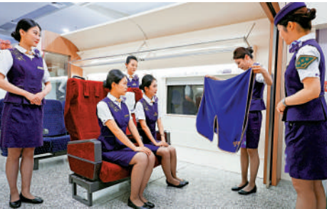
▲6月11日，中國鐵路上海局集團有限公司上海客運段列車長與列車乘務員一起進行服務培訓。中新社

訓過程中發現了列車上的「一個好覺」特色服務——蒸汽眼罩和暖寶寶這些暖心的小物件，滬港動卧列車已經備齊。此外，由於行程較遠，培訓中還會考慮到列車行進途中的一切可能的突發情況，對此，乘務人員們還進行了應急救援和藥品使用等相關知識的培訓。