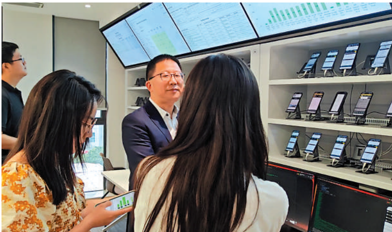
▲SZTDL手機軟件測試空間。