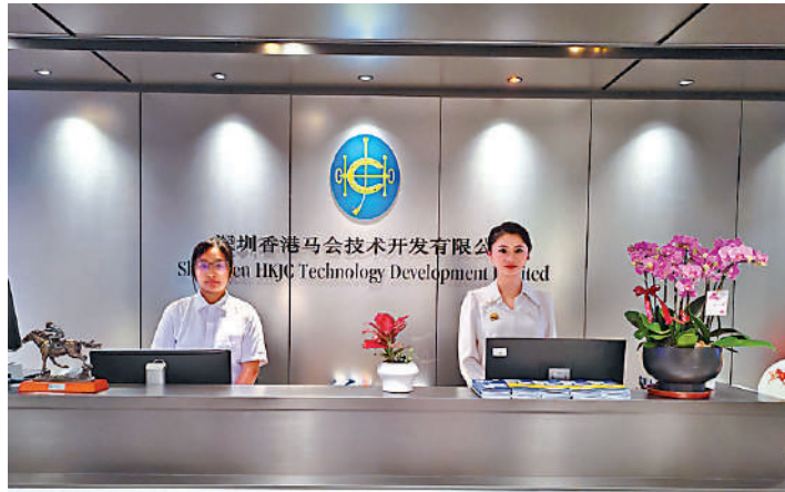
▲SZTDL廣納三地人才。圖為公司前。