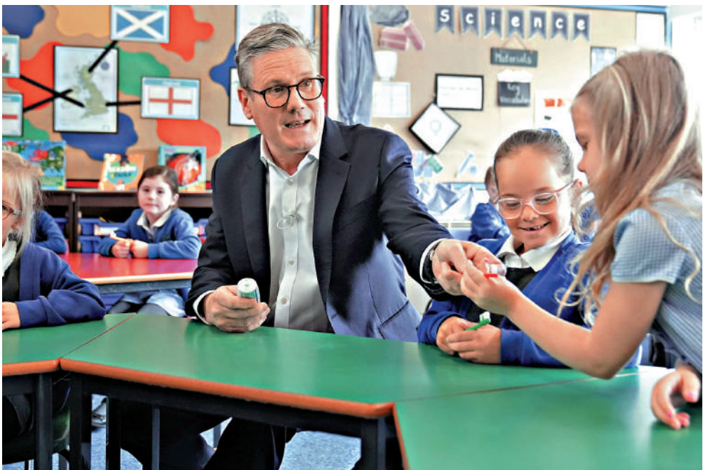
▲工黨黨魁斯塔默11日在米德爾斯堡一所小學探訪。

英國將於7月4日提前舉行大選。執政黨保守黨黨魁、首相蘇納克11日發布競選綱領，核心內容包括承諾減稅、遣送非法移民、為首次購房者提供資助等。在野黨工黨形容該競選綱領是「一份沒有資金支持的絕望清單」，一旦保守黨再執政五年，英國只會更加混亂，而英國人民將為此付出代價。英媒稱，保守黨在多項民調中落後工黨超過20個百分點。