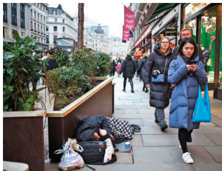
▲倫敦牛津街頭的露宿者。

出，無論誰勝選，都將面臨高債務、高利率和低增長的經濟狀況，是從1950年代以來最嚴峻的挑戰。