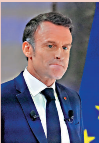
▲法國總統馬克龍。

傳統上，主流政黨採取將極右翼排除在外的「警戒線」策略。共和黨籍參議院議長拉謝表示，他「永遠不會接受」與國民聯盟的協議，並要求西奧蒂辭職。