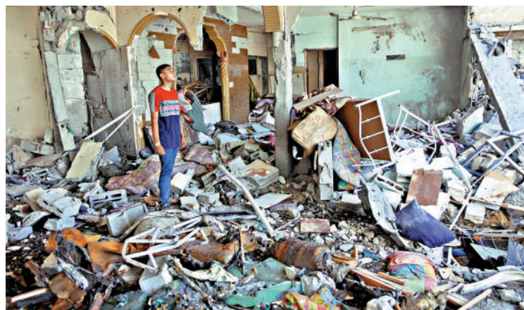
▲加沙城多處民居頻遭以軍轟炸。

加沙政府媒體辦公室12日發布了以色列對加沙發動進攻250天以來造成的損失數據。加沙有37202人死亡，包括15694名兒童，另有10000人失蹤。以色列軍隊投擲了79000噸炸藥，造成的損失初步估計為330億美元。