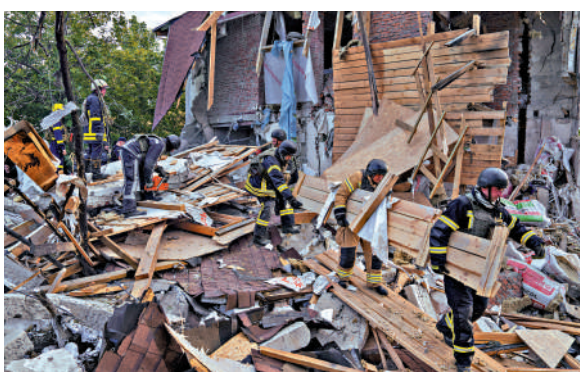
▲烏克蘭哈爾科夫一處建築被炸成廢墟。

匈牙利總理歐爾班12日在布達佩斯表示，匈牙利不會為北約在烏克蘭的行動「出錢出力」，匈牙利不會派遣人員，也不會讓本國領土被用於參與這場衝突。