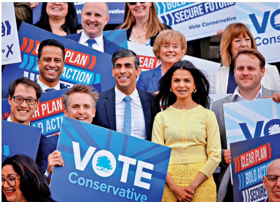
▲英國首相蘇納克（右三）和妻子11日與支持者合影。