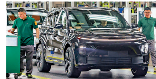
▲中國新能源車競爭力來自技術創新。圖為江蘇常州理想汽車智能製造基地生產車間。

大，完全不會因為價稅就變弱，中國的企業一定會通過控制成本、提升效益、提高供應鏈效率等找到解決和應對方法。