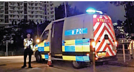
▲▲黃大仙昨晚有電纜故障，多處停電，關愛隊到場協助居民。區內有街燈和交通燈失靈，警車在場戒備。