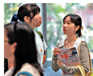
內地大學全球排名提升，吸引力大增。

他指出中醫藥是中國獨有的專科，自新冠疫情以後，中醫藥在海外疫情的防治當中起了很大的作用，所以外國人對中醫藥的認可愈來愈高：「特別是馬來西亞的同學，文化根本與我國文化是相通的，他們對中醫的認可會更高。」他續指，馬來西亞的同學大部分畢業後會返回馬來西亞發展，因為馬來西亞的政策對中醫藥是接受，而其大學的學歷是獲得承認，所以學生回馬來西亞通過註冊就能開業行醫，發展前景是很好。馬來西亞的華人對中醫藥非常認可，相信中