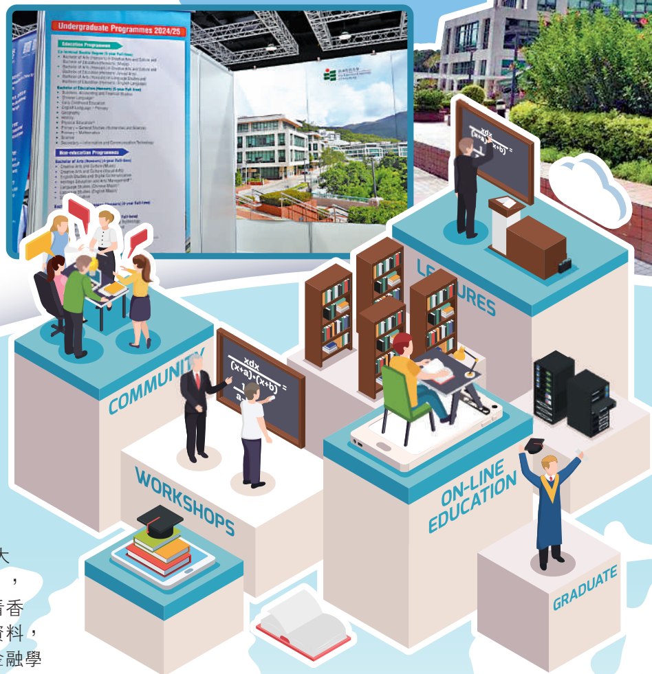
香港教育大學在馬來西亞舉行的中國高等教育展中設有專門攤位介紹學校課程。