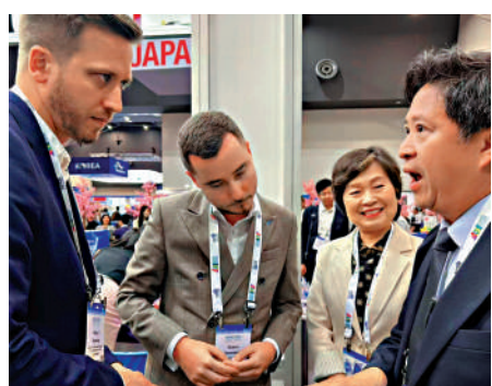
教育局局長蔡若蓮早前率領團前往澳洲的「2024亞太國際教育協會」會議暨展覽，宣傳「留學香港」品牌。

2023年施政報告除了擴大政府資助專上院校非本地生學生限額及相應的宿位，亦擴大獎學金計劃。立法會財務委員會已於2024年2月批准政府向「政府獎學基金」額外注資10億元，增加「一帶一路獎學金」的名額至150個，全額資助「一帶一路」地區的學生來港修讀學士學位及研究院課程。現時，受惠於政府以及其他獎學金計劃的「一帶一路」國家優秀學生