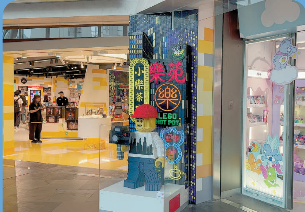
▲朗豪坊樂高店門口的裝置成為打卡熱門。