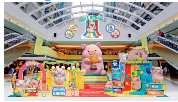
▲5.5米高毛絨版、手持冠軍獎盃的超巨型充氣LuLu豬。