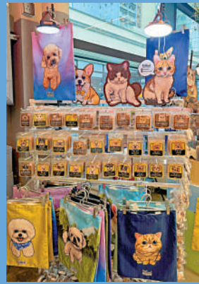
▲中環街市內的市集售賣以寵物為主題的鑰匙扣等小物。