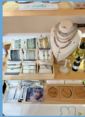
▲白紙生活概念館內售賣的精美水晶。