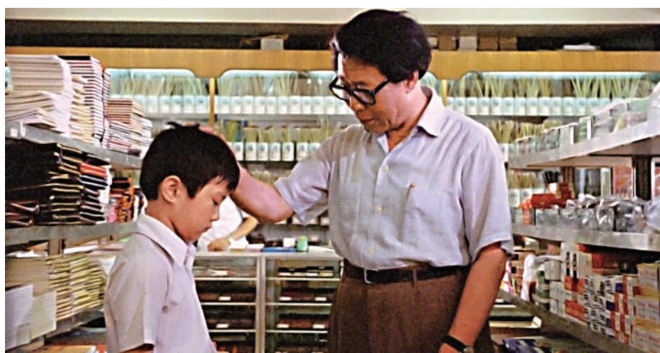
▲開幕電影《父子情》劇照。