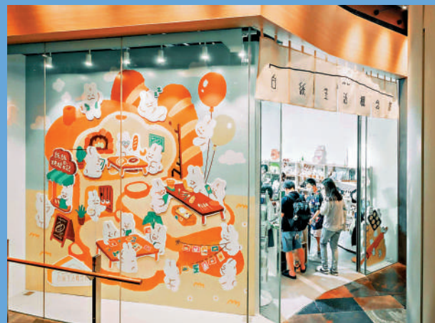
▲白紙生活概念館吸引不少年輕人前來購物。