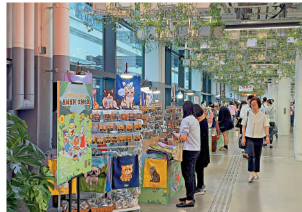
▲市民在中環街市的市集內駐足。