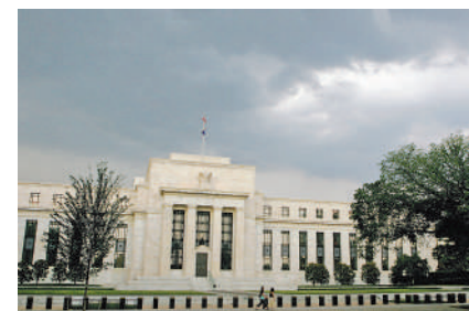
▲市場普遍預期，美聯儲將在9月開始減息。