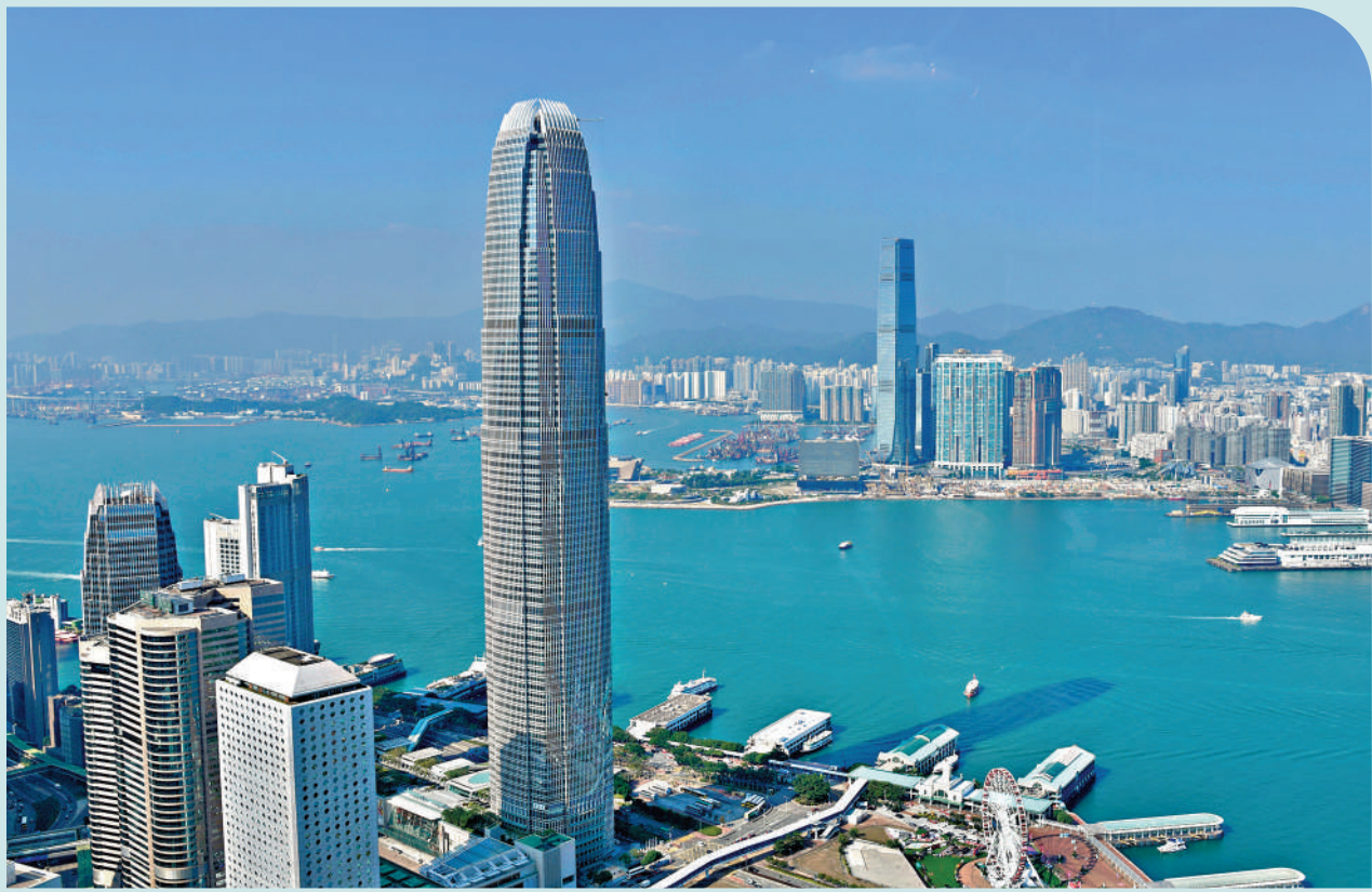
▲香港加快在數字經濟、人工智慧、金融科技等方面的發展，鞏固及提升作為國際級城市的競爭力。

在經歷了亞洲金融危機、互聯網泡沫、全球金融危機和新冠疫情等多次考驗後，回歸後的中國香港依然砥礪前行，經濟韌性在歷史的風雨中得到了充分驗證。展望未來，在全球經濟多元化及數字經濟浪潮的推動下，香港將憑藉其固有的韌性，勇敢迎接新的機遇與挑戰，拾級而上、不斷攀登。