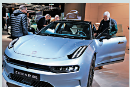
▲2月2日，人們在瑞典斯德哥爾摩舉辦的電動車展上參觀吉利高端電動汽車品牌極氪的新款電動汽車。