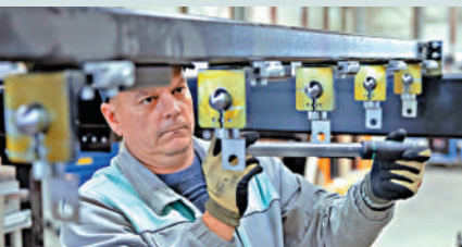
▲1月26日，在匈牙利比奧托爾巴吉，一名工人在蔚來能源歐洲工廠工作。

從2021年進軍歐洲市場以來，蔚來已在歐洲布局43座換電站、46根充電樁、接入超50萬根第三方充電樁；以及7家蔚來中心、8家蔚來空間、55家蔚來服務中心。2022年9月，蔚來在匈牙利比奧托爾巴吉投資建設的首個海外工廠投入運營。