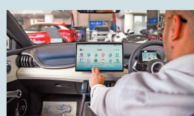
▲5月29日，在馬耳他比爾基卡拉，一名男子坐在一輛比亞迪純電動汽車上體驗。