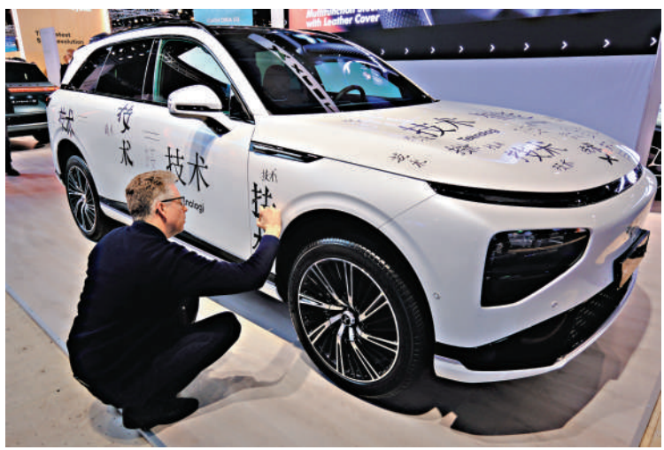
▲2月2日，在瑞典斯德哥爾摩的電動車展，人們在一款中企電動車上用中文寫下「技術」一詞。

歐盟委員會12日發布關於對華電動汽車反補貼調查的初裁，擬從7月4日起對自中國進口的電動汽車徵收17.4%至38.1%不等的臨時反補貼稅。13日的商務部例會上，商務部新聞發言人表示，歐方此舉擾亂中歐新能源車互利合作，涉嫌違反世貿組織規則，中方保留向世貿組織提起訴訟的權利，敦促歐方立即糾正錯誤做法。有美國智库表示，歐盟成員國相互競爭中國電動汽車投資落戶，因為中企為歐洲帶來急需的技術，並創造了就業機會。