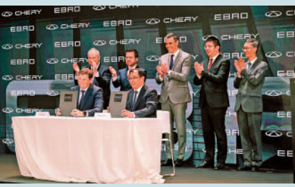
▲4月19日，奇瑞與埃布羅在西班牙巴塞隆那簽署合作協議。

今年4月，奇瑞與西班牙埃布羅公司簽約在當地設立合資工廠，計劃今年第四季投產，是中企首次與西歐發達國家簽署汽車本地化生產協議。