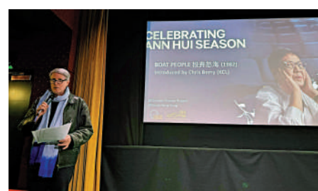
▲「許鞍華回顧展」在英國倫敦的花園電影院舉辦。

英國優質華語電影展映計劃致力透過定期電影放映會及文化活動，在英國推廣華人電影工作者的作品。「許鞍華回顧展」至6月下旬共放映6場，預計招待超過300位觀眾。