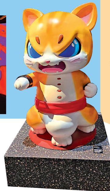
▲阿寬帶來原創IP「功夫三腳貓」。