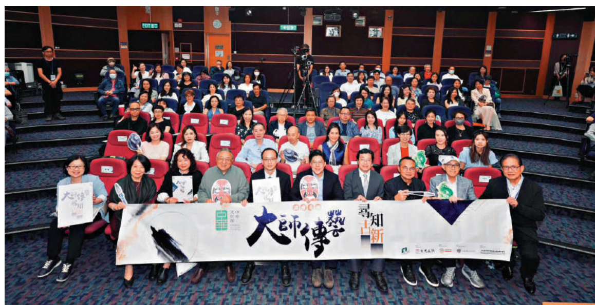
▲「大師傳藝·尋古知新」系列講座昨日舉行開幕禮。