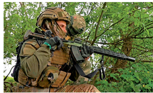
▲俄烏戰場上的俄軍士兵。

一名了解談判情況的人士稱，要確保無論G7的任何一個國家由誰執政，該協議都能維持多年。外界擔憂，如果特朗普在今年的美國大選中勝出，美國對於烏克蘭的支持將大大減少。