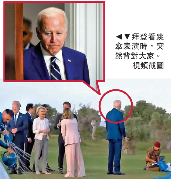
▲拜登看跳傘表演時，突然背對大家。視頻截圖

美國共和黨全國委員會在X平台上傳這段視頻，並發文稱：「拜登在做什麼？」有共和黨支持者稱，梅洛尼「被迫給拜登爺爺當陪護」。(《紐約郵報》)