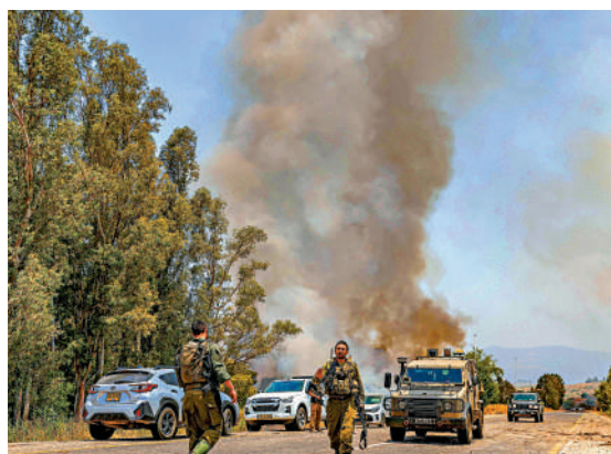
▲黎巴嫩真主黨14日向以色列北部發射火箭彈。

黎巴嫩真主黨13日表示，自2023年10月8日至今6月13日，已對以色列進行了2125次軍事行動，平均每天襲擊達9次；發射了近2000枚各式火箭彈或制導武器，摧毀122個以色列指揮中心、10個「鐵穹」系統平台和7架以軍軍用無人機；造成20多萬以色列人流離失所，迫使以色列人從40多個定居點撤離。