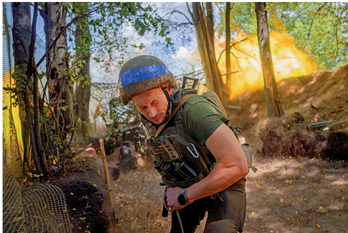
▶一名烏克蘭士兵在哈爾科夫前線發射炮彈。

【大公報訊】剛剛在意大利出席G7峰會的法國總統馬克龍、德國總理朔爾茨、英國首相蘇納克、日本首相岸田文雄及加拿大總理特魯多等國家領導人，將前往瑞士出席烏克蘭和平峰會。