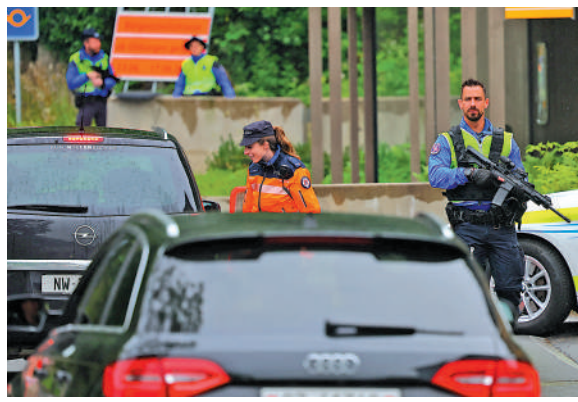
▲瑞士警察在和平峰會舉辦場地附近巡視。

烏克蘭和平峰會將於6月15日至16日在瑞士盧塞恩湖畔舉行。主辦國瑞士稱，峰會旨在啟動烏克蘭和平進程。不過，俄羅斯並未受邀參加，而且部分國家派出參加的官員級別不如預期，輿論認為，該峰會難以實現烏克蘭企圖孤立俄羅斯的目標。俄總統普京14日表示，「北約式外交」正在起反效果。他提出，只要烏軍從烏東四個加入俄聯邦的地區撤軍，俄方將立即停火並開啟談判。