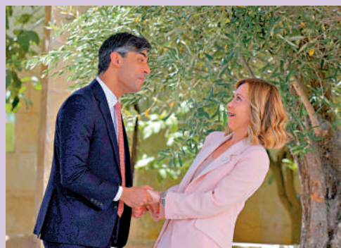
▲英國首相蘇納克和意大利總理梅洛尼(右)13日會面。